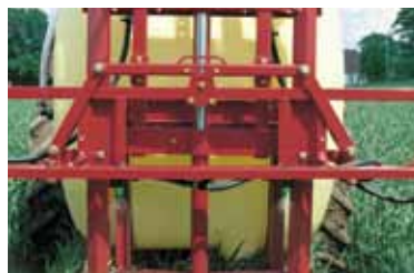
Elevación hidráulica de la barra