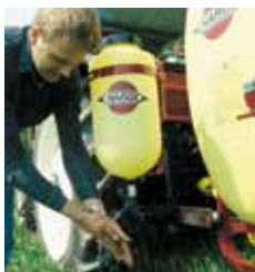
Depósito de agua limpia 15 l.