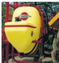
Depósito de lavado