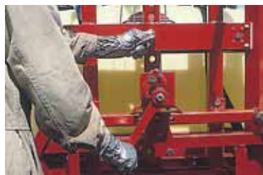
Elevación manual de la barra