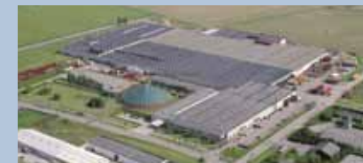
Nørre Alslev, Dinamarca