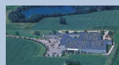
Høje Taastrup, Dinamarca